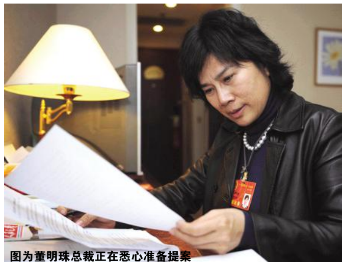
图为董明珠总裁正在悉心准备提案

本报讯 在北京出席十一届全国人大一次会议的全国人大代表、格力电器副董事长兼总裁董明珠,3月6日正式向大会提交2个议案,呼吁进一步完善政府采购鼓励自主创新产品政策、加强科技专项资金拨付管理。